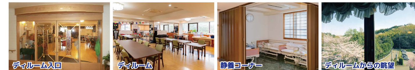
ディールーム入口