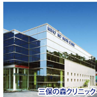
三保の森クリニック