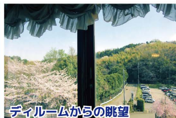
デイルームからの眺望

窓から豊かな自然が望める広い空間を誇るデイルームには、ゆっくりお休みできる静養コーナー、マッサージチェアも設置されている機能訓練コーナー等、利用者様がその日の気分や体調に応じてゆったりとお過ごしいただけるよう、いくつかの空間を設けております