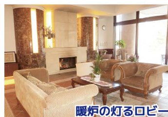
暖炉の灯るロビー