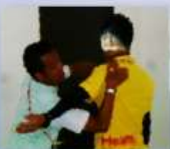
PTのリハビリアドバイス