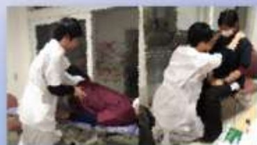
関連病院PTのアドバイス