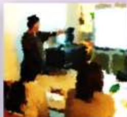
看護師のアドバイス