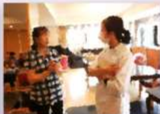
管理栄養士のアドバイス