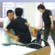
PTの腰痛予防介護指導