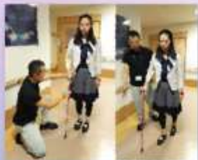
ケガをした職員へのPTの杖処方